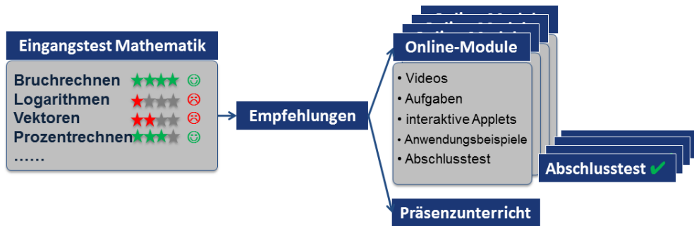
Abb. 2: viaMINT-Grobkonzept für das Fach Mathematik

Die Präsenzübungen setzen zwischen Schritt 3 und 4 an und ergänzen die online vermittelten Inhalte. Einige der Kernpunkte des in Entwicklung befindlichen Konzepts sind: