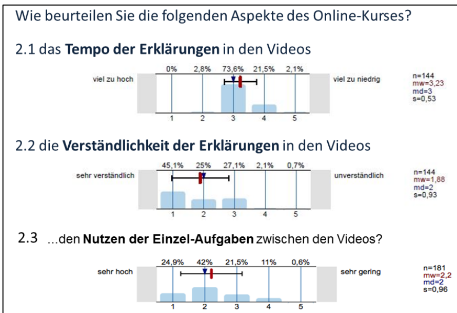
Abb. 5: Evaluationsergebnisse des Einsatzes der ersten Mathematik-Online-Module im Rahmen der Mathematik-Vorkurse im SS 2014 mit n=144/181 Befragten

Seit dem WS 13/14 werden einzelne Online-Module zum Fach Mathematik in die Vorkurse eingebunden und durch die Studierenden evaluiert. Die Studierenden bewerten das Tempo, die Ausführlichkeit und die Verständlichkeit der Lerninhalte sowie insbesondere das Lernen mit Videos insgesamt sehr positiv (siehe Abbildung 5). Eine separate ausführliche Usability-Studie zur Benutzung der einzelnen Module und zum Arbeiten mit dem persönlichen Online-Schreibtisch ist in Vorbereitung.