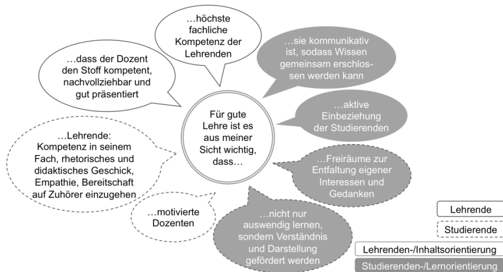
Abb. 2: Beispiel-Aspekte aus Aussagen von Lehrenden und Studierenden

0.816; 95 % CI [0.653, 0.853]). Die Zuordnung der Aspekte zu einer der fünf Kategorien ergab ebenfalls eine gute Beurteiler/innen-Übereinstimmung, \alpha = 0.746 ; 95 % CI [0.607, 0.884] (vgl. KRIPPENDORFF, 2004). Abbildung 2 zeigt exemplarisch von Lehrenden und Studierenden genannte Aspekte, die den Kategorien LO bzw. SO zugeordnet wurden.