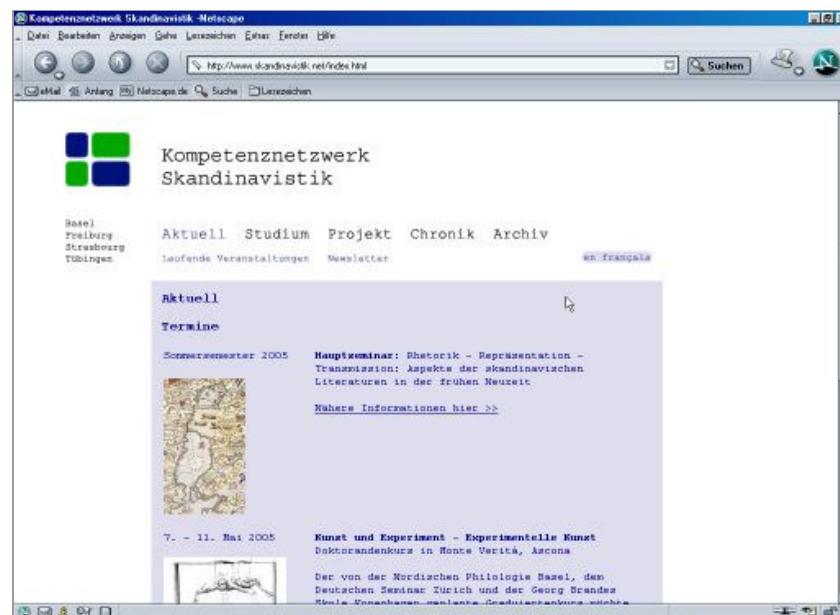
Abb. 3: Informationsportal

Das Informationsportal ( www.skandinavistik.net , vgl. Abb. 3) ist ein gemeinsamer, html-basierter Internetauftritt. Außer- und innercurriculare Veranstaltungen und Aktivitäten der beteiligten Partner werden hier zugänglich gemacht – für die Studierenden und Forschenden aller Universitäten. Gleichzeitig bietet es den Studierenden Einstieg in die internetgestützten Lehrangebote des Kompetenznetzwerkes. Es stehen kurz und einfach gehaltene Leitfäden zur Arbeit mit Lehr- und Lernplattformen, zur Arbeit mit dem Internet und zur wissenschaftlichen Arbeit zur Verfügung. In Zukunft werden hier auch Handreichungen für Dozenten zu den verwendeten Seminarformen zugreifbar sein. Das Informationsportal ist die zentrale Leitinstanz für den Lehraustausch. Der einheitliche Auftritt erleichtert den Zugang zu unterschiedlichen didaktischen Systemen – etwa unterschiedlichen Lehr- und Lernplattformen – und hilft mit seinen verschiedenen Inhalten, unterschiedliche Lehr- und Lerntraditionen aufeinander abzustimmen.